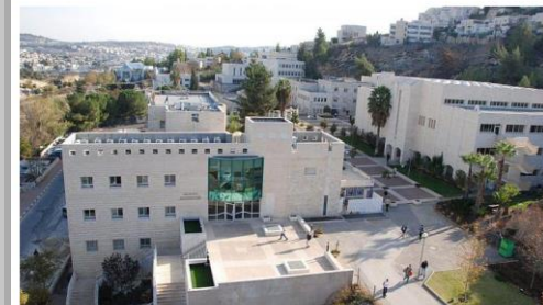
The campus of the Jerusalem College of Technology