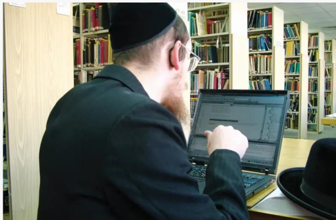
A HAREDI STUDENT works on a computer at the Jerusalem College of Technology.