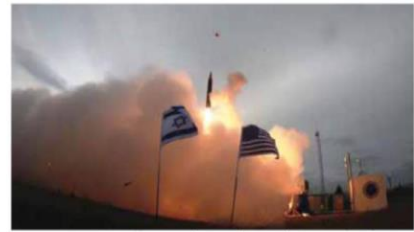
ניסוי טיל החץ באלסקה.

בנוסף לכל הנכונים באוהו מיהקן ביטחוני באלסקה נכחו עיד רבים אחרים, במיתקים צבאיים נוספים בארה"ב, בתעשיות הביטחוניות בארץ, וכמובן בקריה בתל אביב - כצופים בשידור חי". אל"ם ש' הוסיף כי "הגורמים האמריקאים התעניינו מדוע אני מתרגש ועושה כזו טקסיות מנך שסיימתי לקרוא ספר. כדי להמחיש את החשיבות של הגמרא בעם ישראל בשפה שהם מבינים, ועל פי עולם המושגים הצבאי-טכנולוגי שלהם, הסברתי שכמו שבתחום המחקר הביטחוני האמריקאי, ישנה סדרת ספרים עני כרס המוגדרים כספרי יסוד חשובים, כך הגמרא היא הגירסה היהודית לספרים אלו". נשיא המרכז האקדמי לב פרופ' חיים סוקניק אמר כי "המסר של פרופ' זאב לב שייסד את המקום, הוא שילוב עולם התורה והמדע, ושאפשר לעמוד בכל האתגרים, ההוכחה לכך היא אלפי בוגרים שמשתלבים בתפקידים הבכירים והרגישים ביותר בתעשייה הגבוהה והתעשיית ההיי-טק. חייבים לשמר ולאפשר בישראל לימודים טכנולוגיים ברמה הגבוהה ביותר לצד שמירה על חיי תורה ללא פשרות".