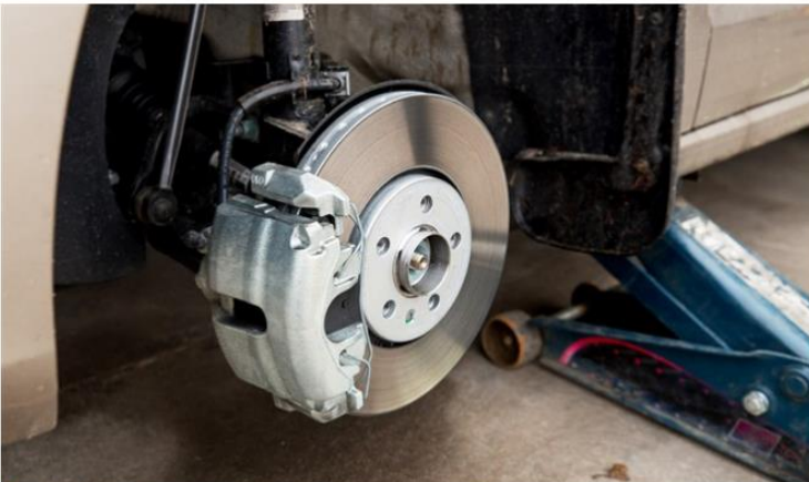
Car brake (stock)