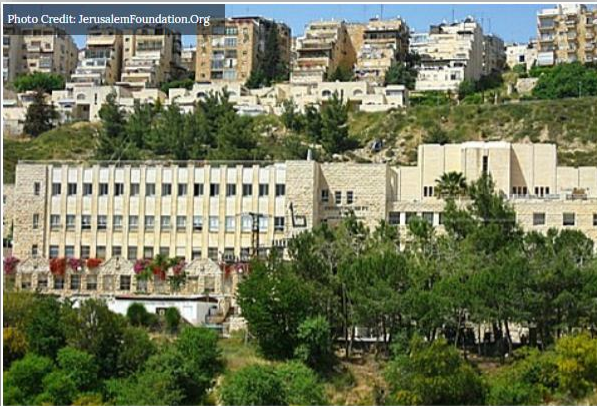
Jerusalem College of Technology

THE JEWISH EXPRESS THE JEWISH PRESS NEWSLETTER