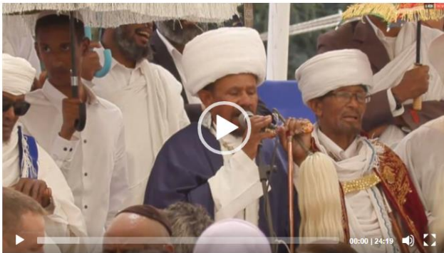
זכרונות צרובים. יונס

ידיא: אזכרה לנספים בדרך לארץ ישראל. ארכיון.